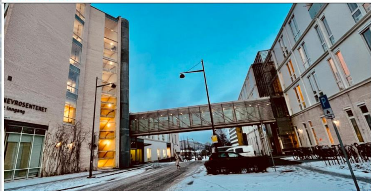
St. Olavs hospital er fullt. Akuttmottaket sliter å sende pasienter videre inn i sykehuset.