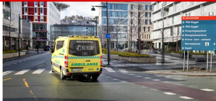
HEVET BEREDSKAP: St. Olavs hospital i Trondheim.