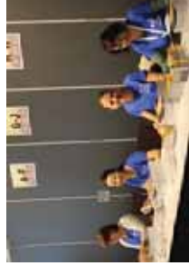
Både danner registrerte deltakere på Landskonferansen.