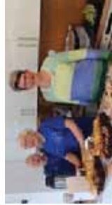
Sanktes forening i Orkdal og omegn, stille med helse og saker på forenning om Orkdalsmodellen i mai.